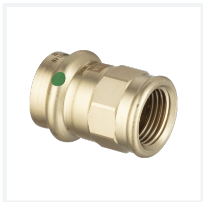
Sanpress-Übergangsstück mit SC-Contur Modell 2212 Artikel 298 111