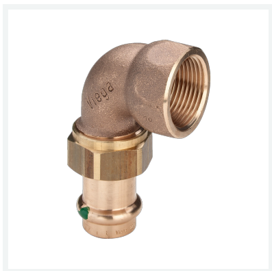
Sanpress-Übergangverschraubung 90° mit SC-Contur Modell 2255 Artikel 132 729