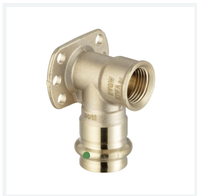
Sanpress-Wandscheibe mit SC-Contur Modell 2225.5 Artikel 335 229