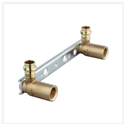
Sanpress-Montageeinheit mit SC-Contur Modell 2221 Artikel 124 502