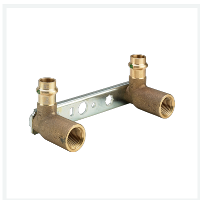
Sanpress-Montageeinheit mit SC-Contur Modell 2221.1 Artikel 135 119