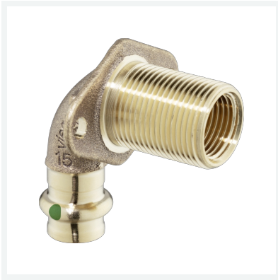
Sanpress-Wanddurchführung mit SC-Contur Modell 2232.1 Artikel 279 301