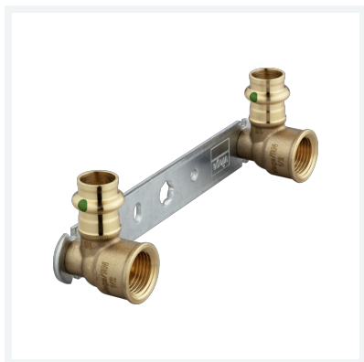
Sanpress-Montageeinheit mit SC-Contur Modell 2222.05 Artikel 308 681