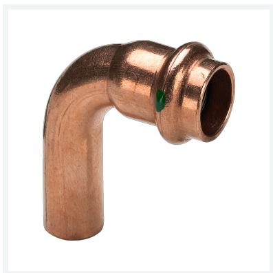
Profipress-Bogen 90° mit SC-Contur Modell 2416.1 Artikel 291 693