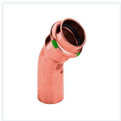
Profipress-Bogen 45° mit SC-Contur Modell 2426.1 Artikel 292 546