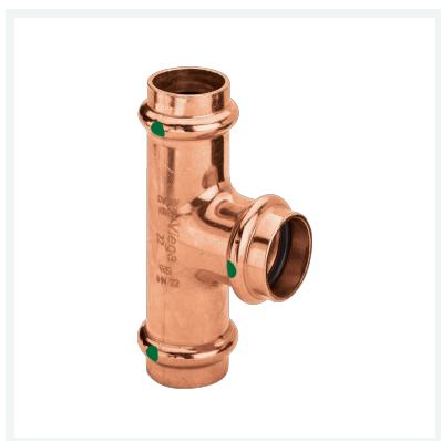
Profipress-T-Stück mit SC-Contur Modell 2418 Artikel 295 196