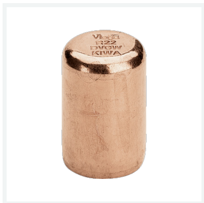
Profipress-Stopfen - Einsteckende Modell 2457