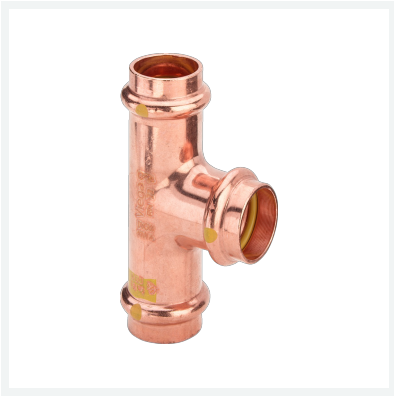
Profipress G-T-Stück mit SC-Contur Modell 2618 Artikel 345 938