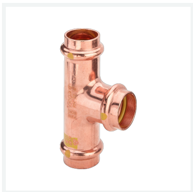
Profipress G-T-Stück mit SC-Contur Modell 2618 Artikel 346 119