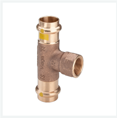
Profipress G-T-Stück mit SC-Contur Modell 2617.2 Artikel 352 707