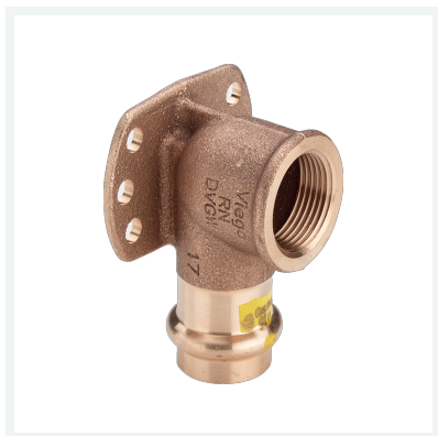
Profipress G-Wandscheibe mit SC-Contur Modell 2625.5 Artikel 346 690