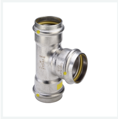
Sanpress Inox G-T-Stück mit SC-Contur Modell 0218 Artikel 486 594