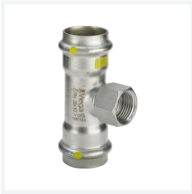
Sanpress Inox G-T-Stück mit SC-Contur Modell 0217.2 Artikel 486 679