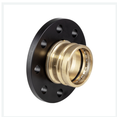
Sanpress XL-Flanschübergang mit SC-Contur Modell 2259.5XL Artikel 479 978