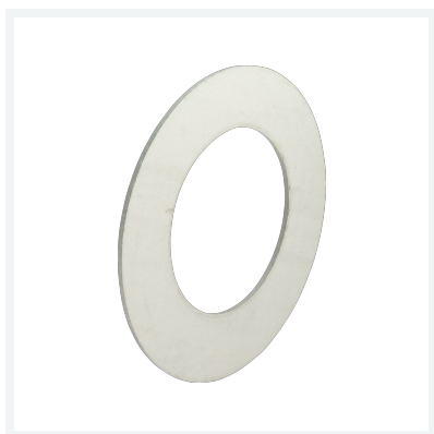
Dichtung Modell 2259.9XL