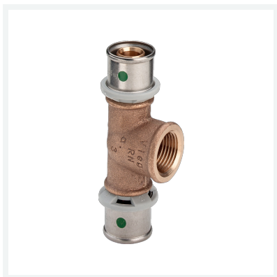
Sanfix P-T-Stück mit SC-Contur Modell 2117 Artikel 566 548