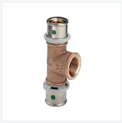
Sanfix P-T-Stück mit SC-Contur Modell 2117 Artikel 599 102