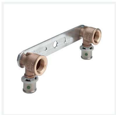
Sanfix P-Montageeinheit mit SC-Contur Modell 2124.05 Artikel 331 542