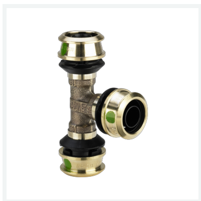
Raxofix-T-Stück mit SC-Contur - Pressanschlüsse Modell 5318