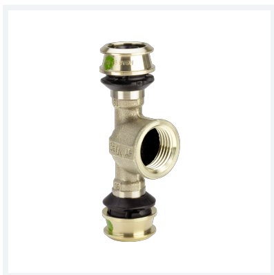
Raxofix-T-Stück mit SC-Contur Modell 5317 Artikel 647 124