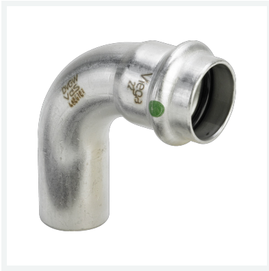
Sanpress Inox-Bogen 90° mit SC-Contur Modell 2316.1 Artikel 435 752