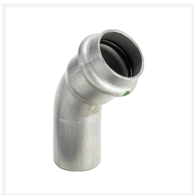
Sanpress Inox-Bogen 45° mit SC-Contur Modell 2326.1 Artikel 435 424