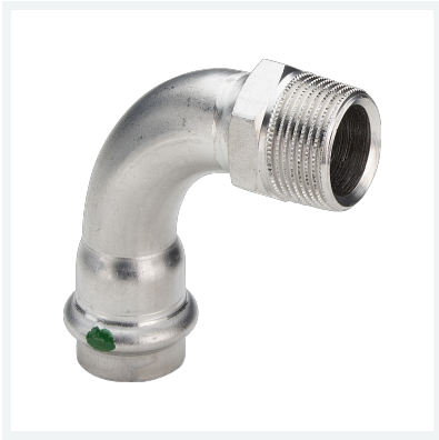
Sanpress Inox-Übergangsbogen 90° mit SC-Contur Modell 2314 Artikel 436 919