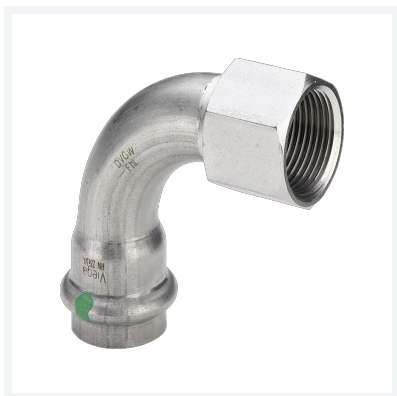
Sanpress Inox-Übergangsbogen 90° mit SC-Contur Modell 2314.5 Artikel 437 121