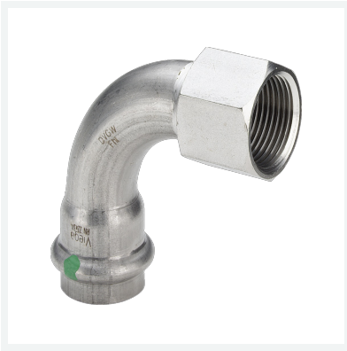
Sanpress Inox-Übergangsbogen 90° mit SC-Contur Modell 2314.5 Artikel 437 138