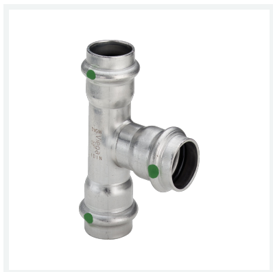
Sanpress Inox-T-Stück mit SC-Contur Modell 2318 Artikel 435 868