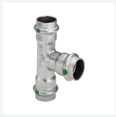
Sanpress Inox-T-Stück mit SC-Contur Modell 2318 Artikel 452 506