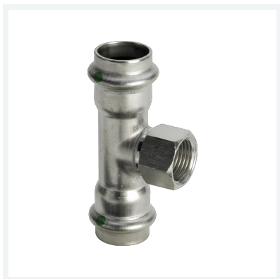
Sanpress Inox-T-Stück mit SC-Contur Modell 2317.2 Artikel 437 206