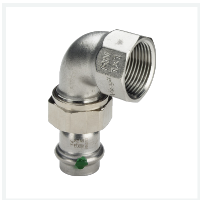
Sanpress Inox-Übergangsverschraubung 90° mit SC-Contur Modell 2355 Artikel 437 329