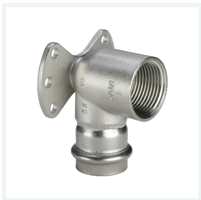
Sanpress Inox-Wandscheibe mit SC-Contur Modell 2325.5 Artikel 437 268