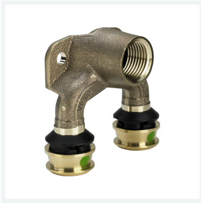
Raxofix-Doppelwandscheibe mit SC-Contur Modell 5325.7 Artikel 645 960