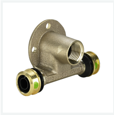
Raxofix-Wandscheiben-T-Stück mit SC-Contur Modell 5324.3 Artikel 647 803