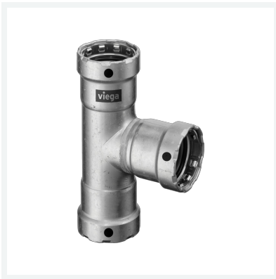
Megapress-T-Stück mit SC-Contur Modell 4218 Artikel 695 019