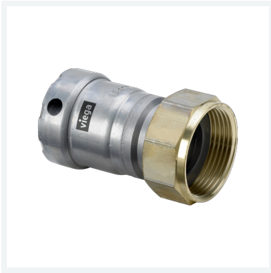
Megapress-Anschlussverschraubung mit SC-Contur Modell 4263 Artikel 718 855