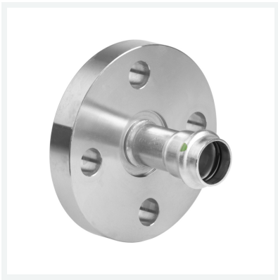
Sanpress Inox-Flanschübergang mit SC-Contur Modell 2359 Artikel 593 322