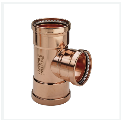
Profipress XL-T-Stück mit SC-Contur Modell 2418XL Artikel 577 735