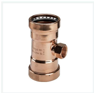
Profipress XL-T-Stück mit SC-Contur Modell 2417.2XL Artikel 577 711