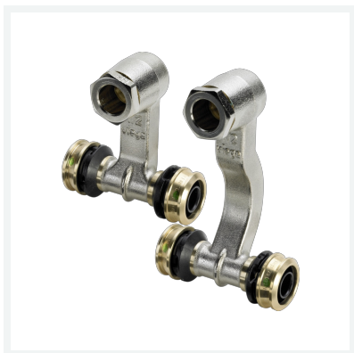
Raxofix-Sockelleisten-Heizkörperanschlusstück mit SC-Contur Modell 5373 Artikel 647 988