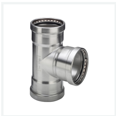
Sanpress Inox XL-T-Stück mit SC-Contur Modell 2318XL Artikel 482 787