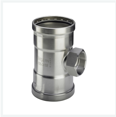
Sanpress Inox XL-T-Stück mit SC-Contur Modell 2317.2XL Artikel 482 886