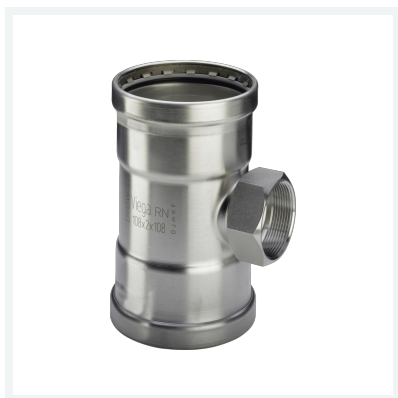
Sanpress Inox XL-T-Stück mit SC-Contur Modell 2317.2XL Artikel 482 893