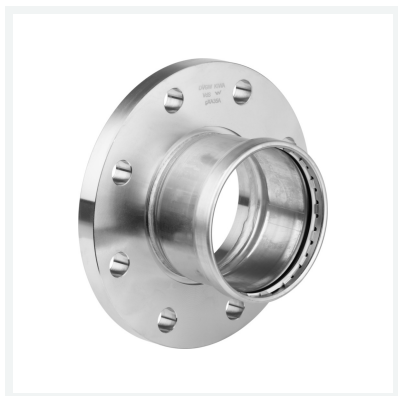
Sanpress Inox XL-Flanschübergang mit SC-Contur Modell 2359XL Artikel 482 978