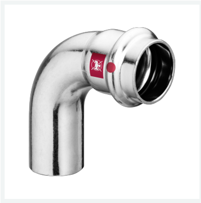
Prestabo-Bogen 90° mit SC-Contur Modell 1116.1 Artikel 558 239