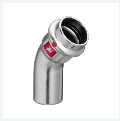
Prestabo-Bogen 45° mit SC-Contur Modell 1126.1 Artikel 558 352