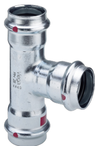
Prestabo-T-Stück mit SC-Contur - Pressanschlüsse Ausstattung Dichtelemente EPDM Modell 1118 Artikel 558 628