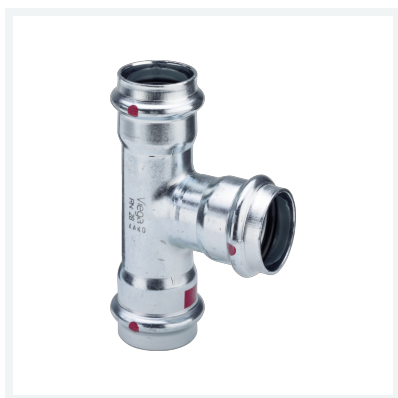
Prestabo-T-Stück mit SC-Contur Modell 1118 Artikel 558 802